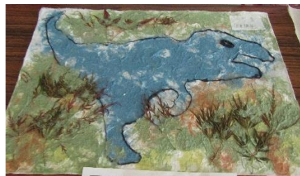
紙すきで作ったタルボサウルス (2年生)