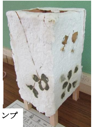
和紙を使ったランプ (4年生)