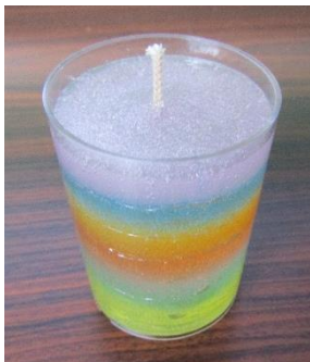
ジェルキャンドル (3年生)