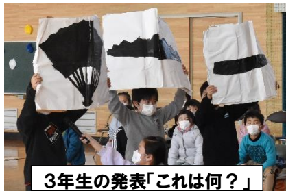
3年生の発表「これは何？」