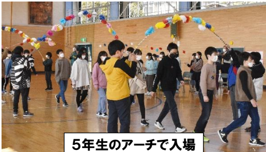
5年生のアーチで入場

卒業まで残りわずかとなりましたが、6年生への感謝の思いをこれからの生活の中でも伝えられるといいですね。