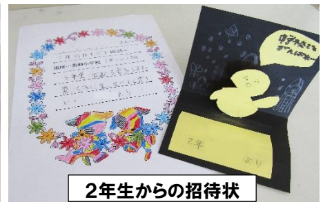
2年生からの招待状