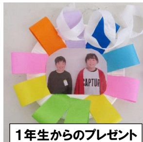
1年生からのプレゼント