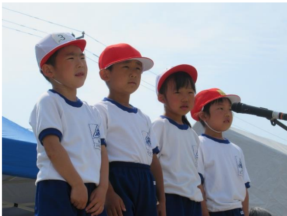
【1年生による「開会のことば」】

運動会への取組を通して身に付けた力をこれからの学校生活に生かし、児童会の目指す新しい自分へのチャレンジにつながることを期待しています。