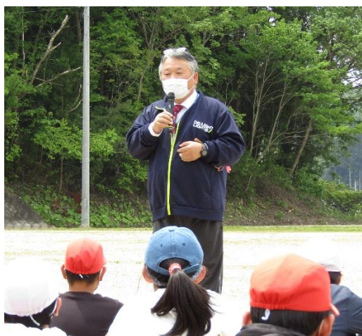
黄海源大鶏舞継承会